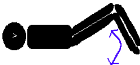
《体をねじる(膝を立てて左右に動かす)》