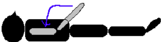
《ひじの曲げ伸ばし》